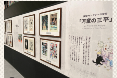
第5章 「水木しげるの漫画ワールド」